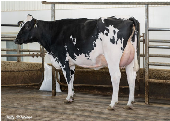
DAIRYDALE MILKTIME CHARLEY

L TO R - DRAGON MILKTIME 4204, DRAGON MILKTIME 4202, DRAGON MILKTIME 2236